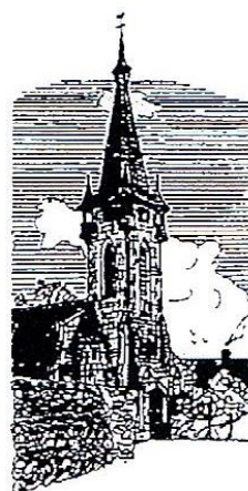
Brain sur Vilaine