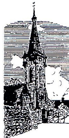
Brain sur Vilaine