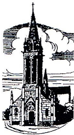
La Chapelle de Brain