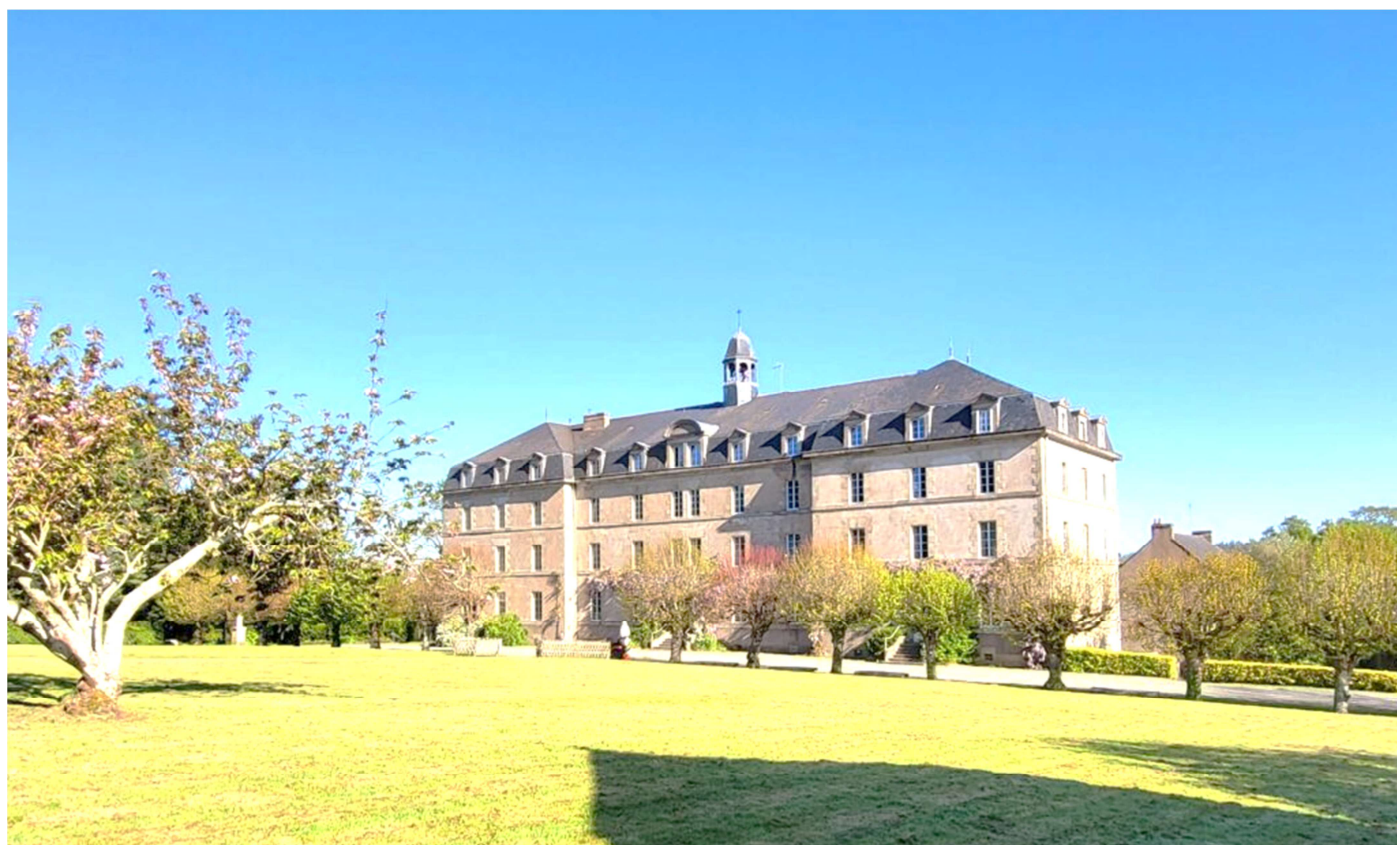
La Roche du Theil 2024