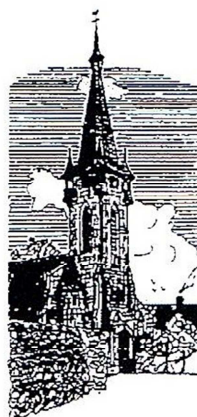
Brain sur Vilaine