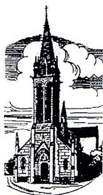
La Chapelle de Brain