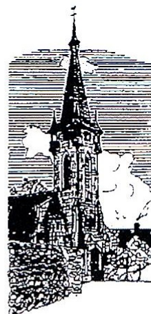
Brain sur Vilaine